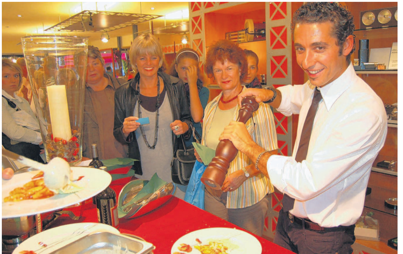
Donaueschinger Geschäfte werden in der dritten kulinarischen Nacht wieder zu echten Feinschmecker-Adressen. Dazu gibt es ein abwechslungsreiches Musikprogramm.